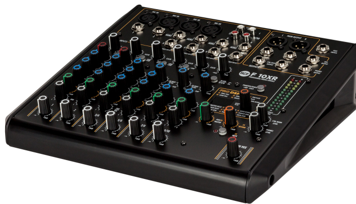
Table de mixage 10 canaux avec multi-effets et enregistrement